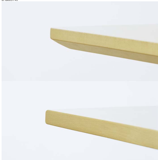
F-kannet = viistetyt reunat, S-kannet = suorat reunat