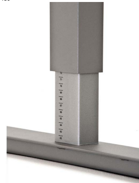
Korkeussäättö 610-900 mm