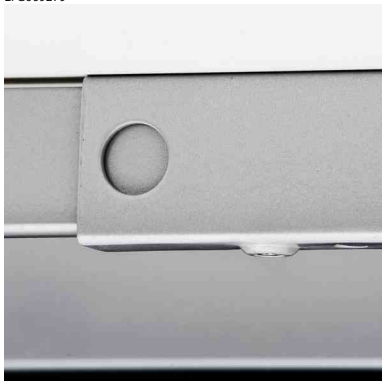
Portaattomasti leveysuunnassa säädettävä runko