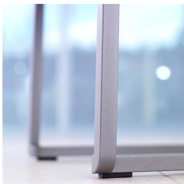
Maalattu runko, struktuuriharmaa (26).