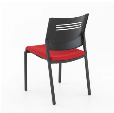
P40C60-tuoli, verhoiltu istuin ja musta muoviselkänoja.