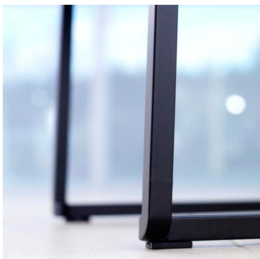
Maalattu runko, struktuurimusta (24).